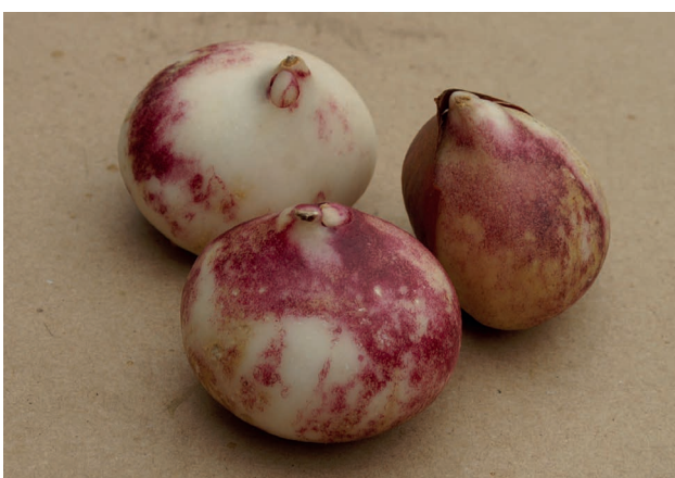
Schadebeeld op de bol: crêmegele of dofrode verkleuring op de witte bolrokken.

Al met al zullen we nog wel even aan het zoeken zijn naar de beste manier van toepassen. Juist daarom zeg ik het nog maar een keer: probeer op je eigen bedrijf uit te vinden waar in het verwerkingsproces de mogelijkheden liggen voor Flipper Plus en ga ermee oefenen, dan weet je straks hoe het moet.”